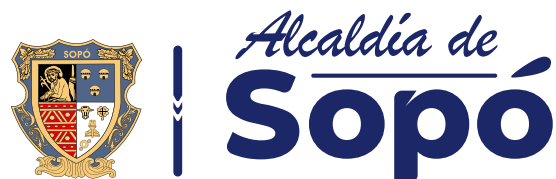
Cambios en la tipografía.

Aquí unos ejemplos del uso inadecuado del logotipo, que no hacen parte de la identificación de marca.